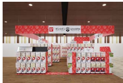
▲『ガシャポンバンダイオフィシャルショップ』葛屋書店 長岡花園店

近年カプセルトイ業界では、大型のカプセルトイ専門店が増加し、身近なエンターテインメントとして多くのお客さまに楽しまれています。バンダイのオリジナルのカプセルトイブランドである「ガシャポン」ならではの「ワクワク体験」と「ユニークな商品」をファンの皆さまに向けて直接お届けしたいという思いから、バンダイと大型カプセルトイ専門店の運営ノウハウを持つバンダイナムコアミューズメントが協業で店舗を出店します。