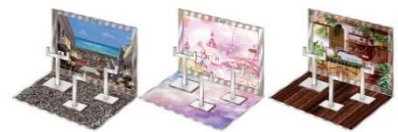
▲おうちでガシャ撮り(全1種) ※付属背景(全3種)