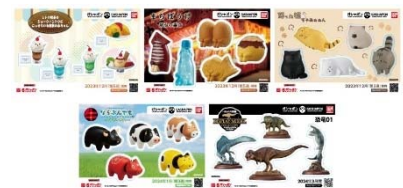
▲オリジナルステッカー(全5種)