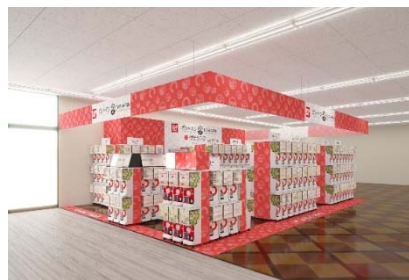
▲『ガシャポンバンダイオフィシャルショップ』蔦屋書店 中野店

近年カプセルトイ業界では、大型のカプセルトイ専門店が増加し、身近なエンターテインメントとして多くのお客さまに楽しまれています。バンダイのオリジナルのカプセルトイブランドである「ガシャポン」ならではの「ワクワク体験」と「ユニークな商品」をファンの皆さまに向けて直接お届けしたいという思いから、バンダイと大型カプセルトイ専門店の運営ノウハウを持つバンダイナムコアミューズメントが協業で店舗を出店します。