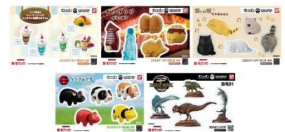
▲オリジナルステッカー(全5種)