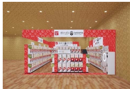
▲『ガシャポンバンダイオフィシャルショップ』 蔦屋書店 イオンタウン仙台泉大沢店

近年カプセルトイ業界では、大型のカプセルトイ専門店が増加し、身近なエンターテインメントとして多くのお客さまに楽しまれています。バンダイのオリジナルのカプセルトイブランドである「ガシャポン」ならではの「ワクワク体験」と「ユニークな商品」をファンの皆さまに向けて直接お届けしたいという思いから、バンダイと大型カプセルトイ専門店の運営ノウハウを持つバンダイナムコアミューズメントが協業で店舗を出店します。