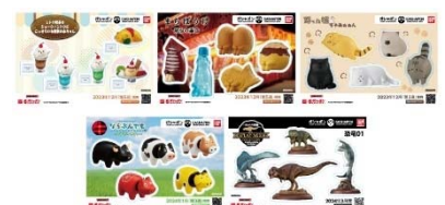
▲オリジナルステッカー(全5種)