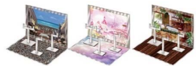
▲おうちでガシャ撮り(全1種) ※付属背景(全3種)

対象3アカウントすべてをフォローしてキャンペーンポストをリポストした方の中から抽選で5名さまに、おうちでガシャ撮りが楽しめる「おうちでガシャ撮り」をプレゼント！ ※こちらのデザインは予告なく変更する場合がございます。