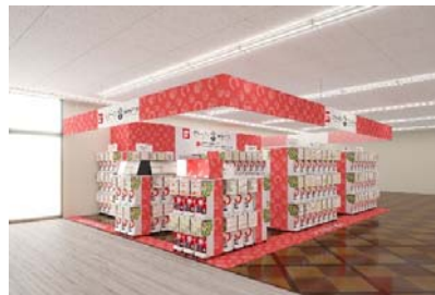
▲『ガシャポンバンダイオフィシャルショップ』蔦屋書店 須坂店

近年カプセルトイ業界では、大型のカプセルトイ専門店が増加し、身近なエンターテインメントとして多くのお客さまに楽しまれています。バンダイのオリジナルのカプセルトイブランドである「ガシャポン」ならではの「ワクワク体験」と「ユニークな商品」をファンの皆さまに向けて直接お届けしたいという思いから、バンダイと大型カプセルトイ専門店の運営ノウハウを持つバンダイナムコアミューズメントが協業で当店舗を出店します。