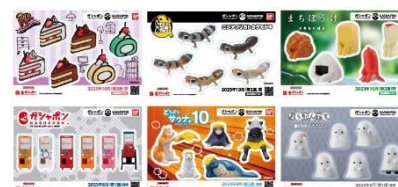
▲オリジナルステッカー(全6種)