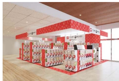
▲『ガシャポンバンダイオフィシャルショップ』葛屋書店 新発田店

近年カプセルトイ業界では、大型のカプセルトイ専門店が増加し、身近なエンターテインメントとして多くのお客さまに楽しまれています。バンダイのオリジナルのカプセルトイブランドである「ガシャポン」ならではの「ワクワク体験」と「ユニークな商品」をファンの皆さまに向けて直接お届けしたいという思いから、バンダイと大型カプセルトイ専門店の運営ノウハウを持つバンダイナムコアミューズメントが協業で当店舗を出店します。