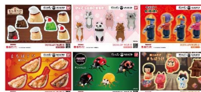
▲オリジナルステッカー(全6種)

さらに！書店内で展開するガシャポンバンダイオフィシャルショップでしか入手できないコミック本サイズの「オリジナルブックカバー」がその場で当たるキャンペーンを実施！ 各日20名さまに当たります。