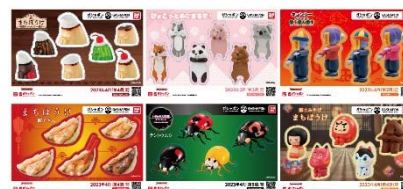
▲オリジナルステッカー(全6種)