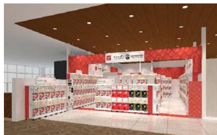
▲『ガシャポンバンダイオフィシャルショップ』蔦屋書店 龍ケ崎店

近年カプセルトイ業界では、大型のカプセルトイ専門店が増加し、身近なエンターテインメントとして多くのお客さまに楽しんでいます。バンダイのオリジナルのカプセルトイブランドである「ガシャポン」ならではの「ワクワク体験」と「ユニークな商品」をファンの皆さまに向けて直接お届けしたいという思いから、バンダイと大型カプセルトイ専門店の運営ノウハウを持つバンダイナムコアミューズメントが協業で店舗を出店します。