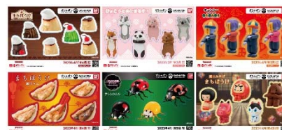
▲オリジナルステッカー(全6種)