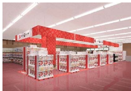
▲『ガシャポンバンダイオフィシャルショップ』蔦屋書店 横越バイパス店

近年カプセルトイ業界では、大型のカプセルトイ専門店が増加し、身近なエンターテインメントとして多くのお客さまに楽しまれています。バンダイのオリジナルのカプセルトイブランドである「ガシャポン」ならではの「ワクワク体験」と「ユニークな商品」をファンの皆さまに向けて直接お届けしたいという思いから、バンダイと大型カプセルトイ専門店の運営ノウハウを持つバンダイナムコアミューズメントが協業で店舗を出店します。