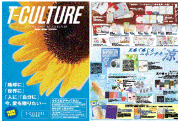
情報カタログ「T-CULTURE 夏号」