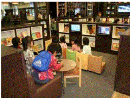
キッズコーナーイメージ

港北ミナモ店のコンセプトは、「コミュニティが生まれる店舗」です。生活をより豊かにするための映画、音楽、書籍、文具、ファンシー雑貨といったエンターテインメントコンテンツを取り揃え、1,000坪の大空間でご提案いたします。書籍売場はスターバックスコーヒーを併設。コーヒーを片手にゆっくりと本を選んだり、読書したりと贅沢な時間をお過ごしいただけます。また、港北ニュータウンならではのこだわりとしてお子様向けの書籍やDVDも大充実。お子様が読書やアニメ鑑賞をしたり、絵本の読み聞かせができるようなキッズコーナーも設置。関東最大級規模のエンターテインメントショップの旗艦店として、港北周辺からご利用されるお客様がご家族や友人、恋人と楽しくいつでも利用したくなるようなコミュニティが生まれる店舗を目指します。