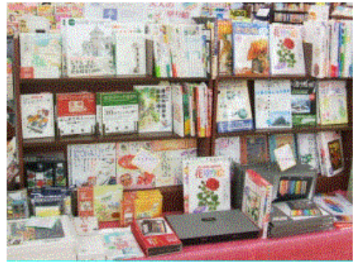
ミックス売場 大人の塗り絵