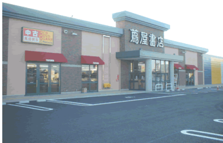
伊勢崎平和町店 外観