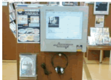
CDのバーコードを読み取って曲を呼び出し