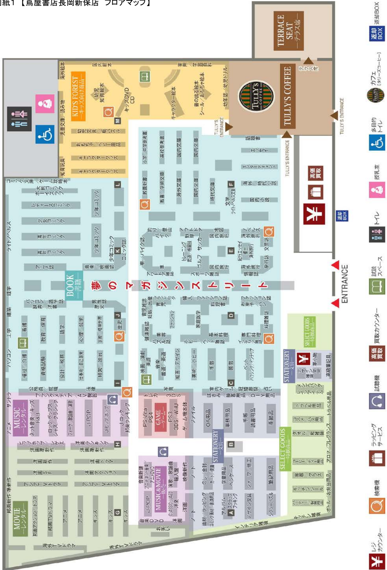
別紙1【蔦屋書店長岡新保店 フロアマップ】