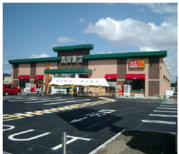
店舗外観イメージ（写真は南笹口店（新潟市））

想定する近隣人口が大幅に増加（近隣人口イメージ） 近隣人口：店舗を中心にした半径 3 km 圏内の人口