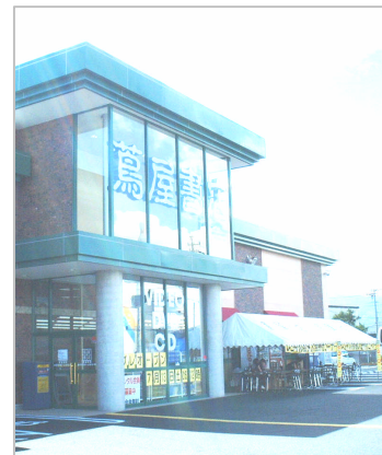
蔦屋書店 豊科店 オープン前、レンタル会員特設入会受付を設置